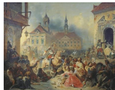
Осада крепости Нарвы №

2. 1 мая 1703 года пала шведская крепость Ниеншанц. Осада крепости была недолгой. По приказу Петра I Ниеншанц переименовали в Шлотбург - город-замок. Для России открылся выход в Балтийское море.